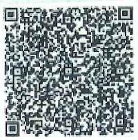
岑敬的年检二维码

本证书经检验合格，继续有效一年。 This certificate is valid for another year after this renewal.